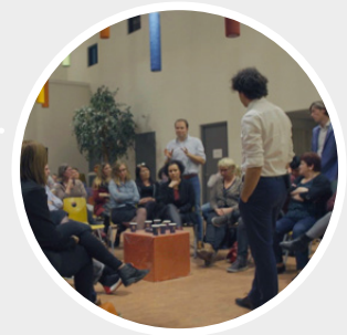
In 2018 ging Jesse Klaver in een kantine toer in gesprek met mensen uit de publieke sector. Op 9 september organiseerden we de grootste kantine van Nederland in Afas Live

Parallel aan de start van het schrijven van het programma voor de volgende Tweede Kamerverkiezingen organiseren we debat- en themaavonden over belangrijke thema's die in het programma aan de orde komen. We zoeken nieuwe manieren om online en offline met leden en sympathisanten in gesprek te gaan. Om elkaar te inspireren, van elkaar te leren en het debat aan te gaan