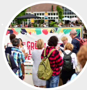
In juni 2018 hadden we ons eerste GroenLinks Festival met workshops en debat